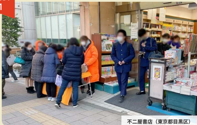
不二屋書店（東京都目黒区）