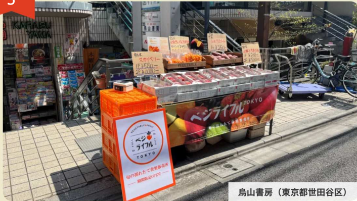
鳥山書房 (東京都世田谷区)