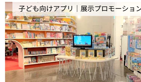
子ども向けアプリ | 展示プロモーション