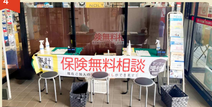
ブックスなにわ仙台泉店 (宮城県仙台市)