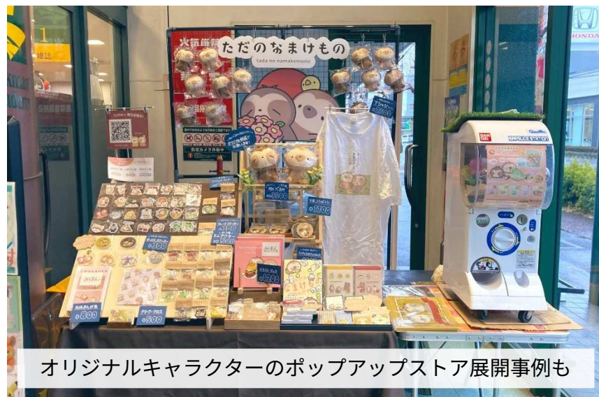
オリジナルキャラクターのポップアップストア展開事例も

他業態の商業店舗も併設されたパワーセンターは特に企業からの人気が高く、申込ランキング上位スペースに！