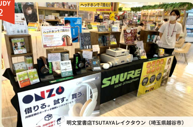
明文堂書店TSUTAYAレイクタウン（埼玉県越谷市）