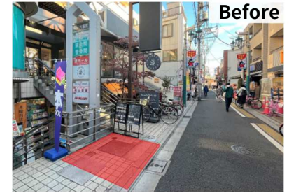
千歳烏山の商店街の好立地。地元の生活者の方が多く買い物や通勤で往来するスペース。

当店の常連さんや地域住民の方などが関心を持って下さり、店頭で活気ができました。特に主婦層の通りが多い商店街なので青果販売は相性が良かったと思います。普段は活用できていないスペースなので有難いです。