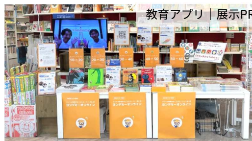
教育アプリ | 展示PR