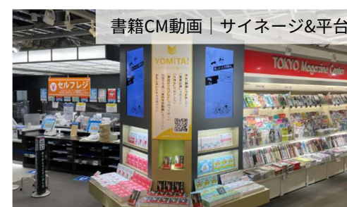
書籍CM動画 | サイネージ&平台

事例はWEBサイトからもご覧いただけます。 https://bookmarkspace.jp/article/work/onzo/