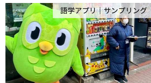
語学アプリ | サンプリング