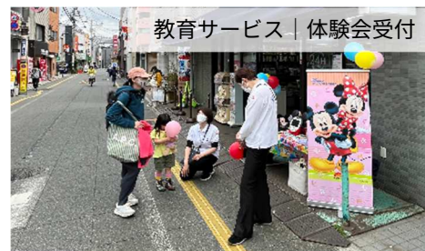
教育サービス | 体験会受付

展開日だけ什器を移動してスペース確保。ちょっとしたスペースを収益化！なんと月の予約が全日埋まったこともある大人気スペースに！