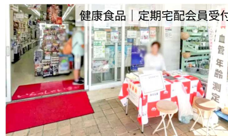
健康食品 | 定期宅配会員受付