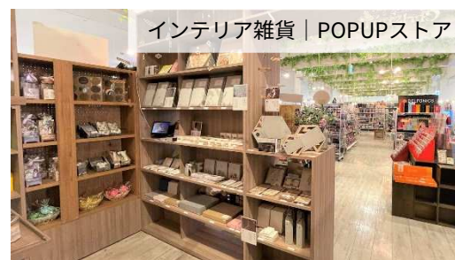
インテリア雑貨 | POPUPストア