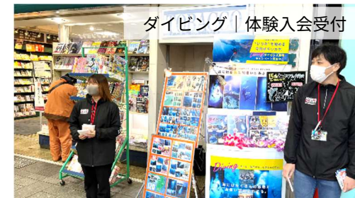
ダイビング | 体験入会受付