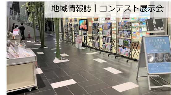
地域情報誌 | コンテスト展示会