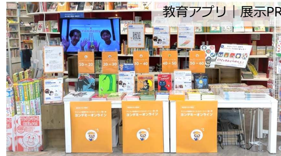
教育アプリ | 展示PR