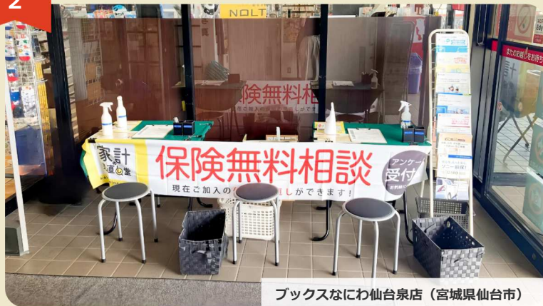
ブックスなにわ仙台泉店 (宮城県仙台市)