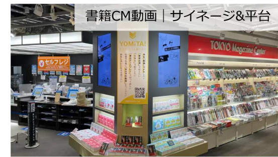
書籍CM動画 | サイネージ&平台

事例はWEBサイトからもご覧いただけます。 https://bookmarkspace.jp/article/work/onzo/