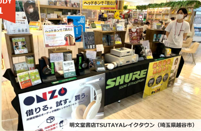
明文堂書店TSUTAYAレイクタウン (埼玉県越谷市)