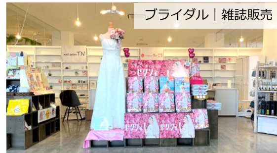
ブライダル | 雑誌販売